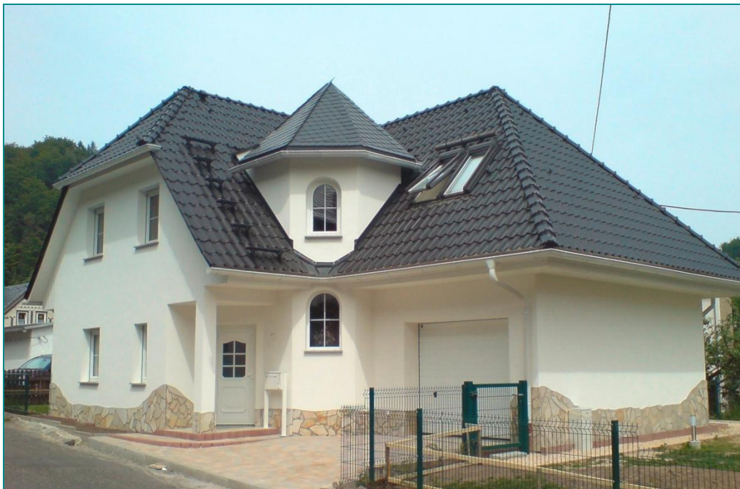
Haus Martina, schlüsselfertig mit Sonderausstattung

Exklusives Eckhaus mit Anbau und Türmchen für