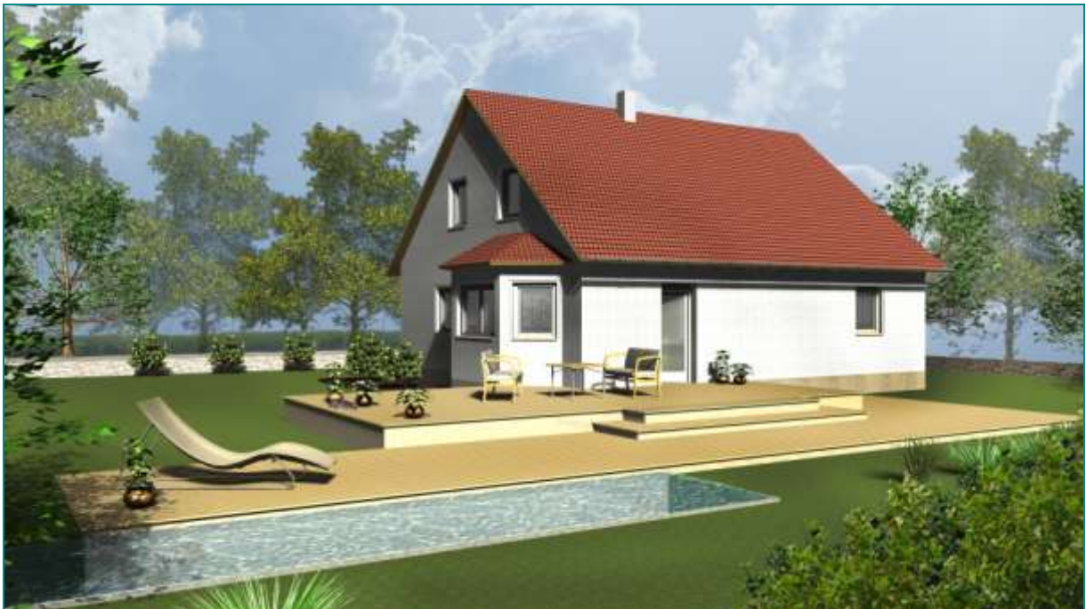
Haus Mia, schlüsselfertig mit Sonderausstattung

Satteldachhaus mit Erker und bezugsfertigem Erdgeschoss für