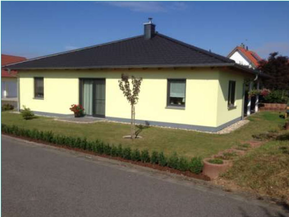
Haus Mandy, schlüsselfertig mit Sonderausstattung

Bungalow mit großzügig überdachter Terrasse und Zeltdach für