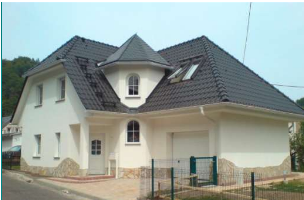
Haus Martina, schlüsselfertig mit Sonderausstattung

Exklusives Eckhaus mit Anbau und Türmchen für