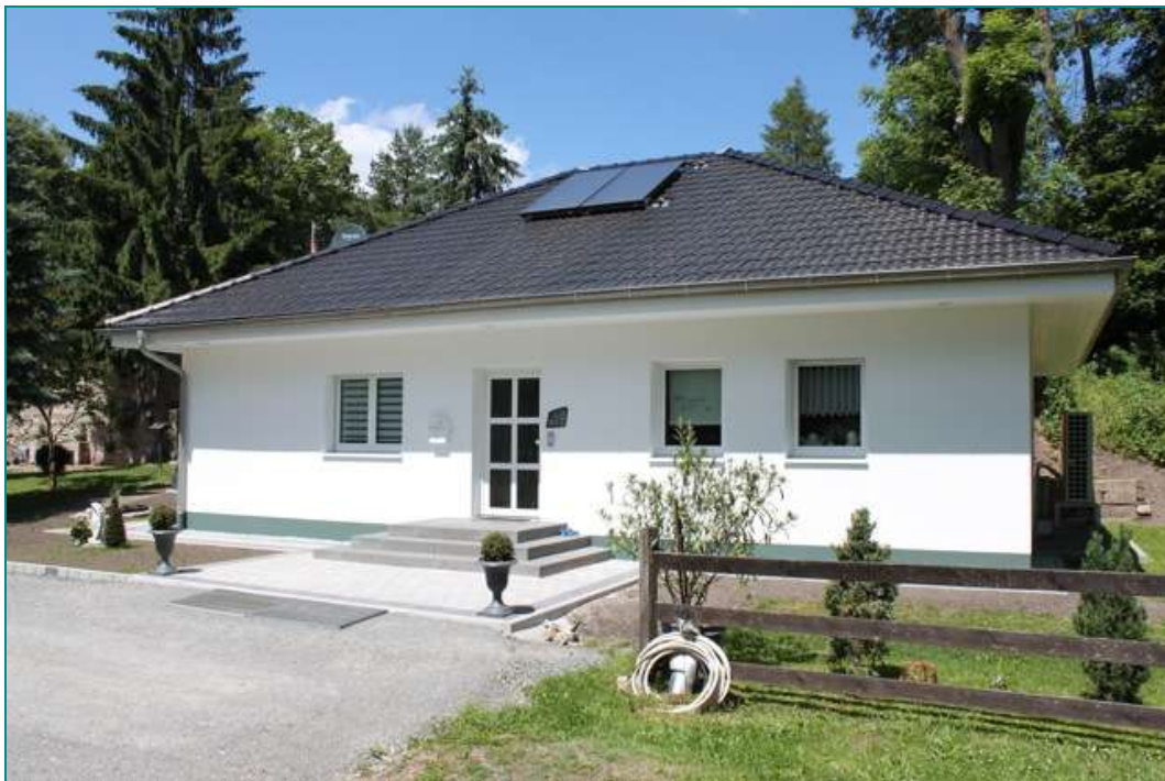
Grundversion Haus Paula und Emma

Mitbaubungalow als Ausbauhaus, außen fertig für